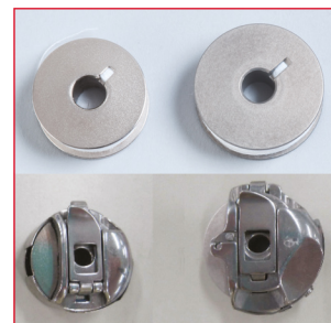
1.4 X bobina más grande