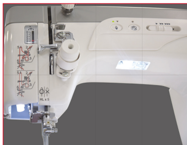
Iluminación LED de alta intensidad